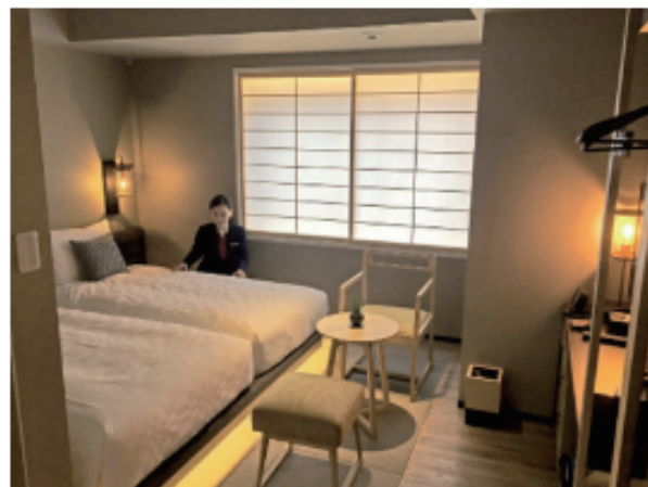
リソルホテルが関西初の宿泊施設としてオープンさせる宿泊主体型ホテルの客室(京都市中京区)

宿泊主体型ホテル運営のリソルホテル(東京)は29日、関西初となる宿泊施設「ホテルリソル京都 河原町三条」(京都市中京区)を公開した。坂本龍馬とともに大政奉還の立役者となった土佐藩重臣、後藤象二郎(1838～97年)の寓居(くうぎょ)があった場所にちなみ、記念のギャラリーを併設している。6月1日に開業する。